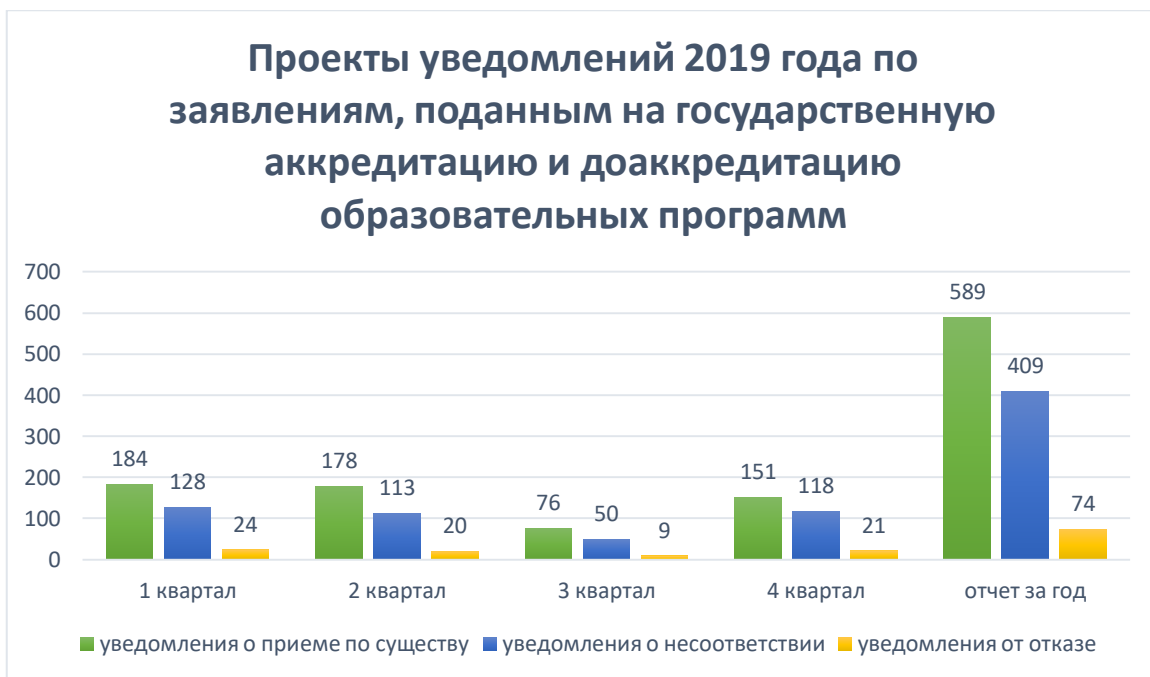
Рис. 1. Проекты уведомлений, подготовленные в 2019 году по заявлениям, поданным на государственную аккредитацию и доаккредитацию образовательных программ