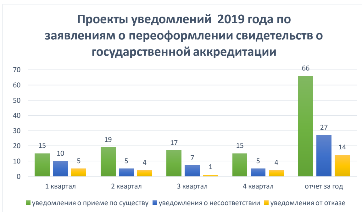
Рис. 2. Проекты уведомлений, подготовленные по заявлениям о переоформлении свидетельства о государственной аккредитации в 2019 году

По заявлениям о переоформлении свидетельств о государственной аккредитации подготовлен 107 проектов уведомлений, из них: 66 (62%) проектов уведомлений о приеме заявления и прилагаемых документов к рассмотрению по существу; 14 (13%) проектов уведомлений об отказе в приеме документов к рассмотрению по существу; 27 (25%) проектов уведомлений о несоответствии (рис. 2.).